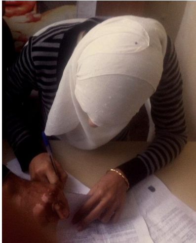
Die Empfänger tragen sich in die zentrale Liste ein