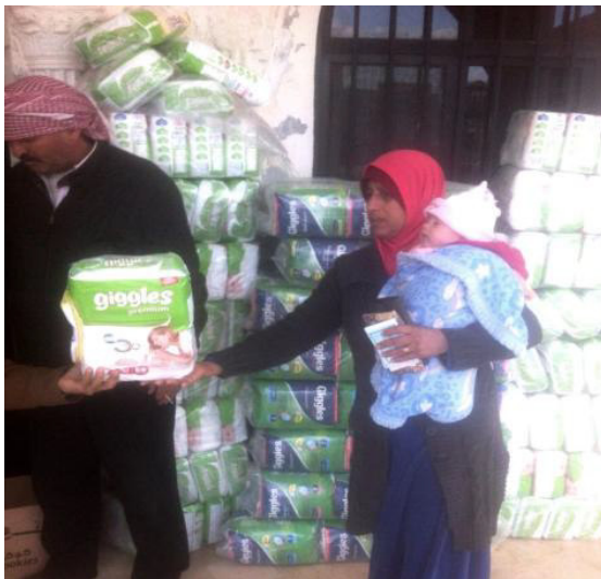
Windeln und Milchpulver für 1.500 Säuglinge