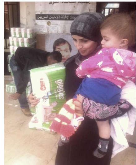
Orientshelfer e.V. startete damit im November 2014